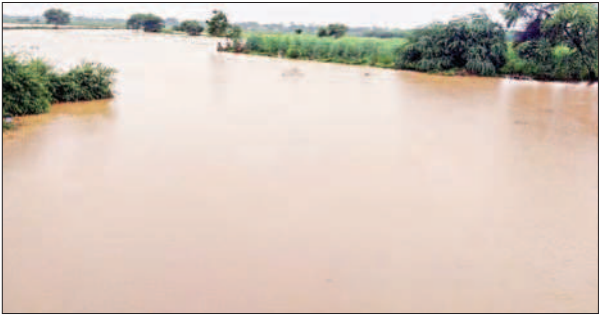
కామేపల్లి, ఆగస్టు 31 ప్రభాతవార్త: కామేపల్లి మండలంలో శనివారం

పొంగిపొర్లుతున్న వాగులు, వంకలు జలకళను సంతరించుకున్న చెరువులు ఎడతెరిపి లేని వర్షంతో సామాన్య ప్రజాజీవనం అస్తవ్యస్తం